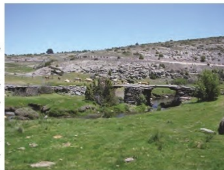
PUENTE DE PIZARRA

Desde dicha taina, giramos a la derecha para ascender por una senda que discurre por la línea de cresta que separa los dos valles de los ríos Zarzas y