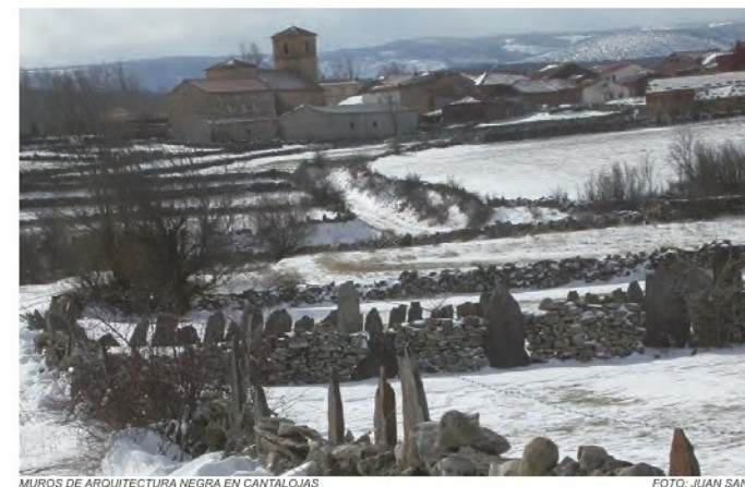
MUROS DE ARQUITECTURA NEGRA EN CANTALOJAS

En el cercano pueblo de Cantalojas, podremos disfrutar de la belleza de unos de los pueblos incluidos en la zona de Arquitectura Negra de Guadalajara, en el que destacan por su originalidad los muros de piedra en las fincas que rodean el pueblo.