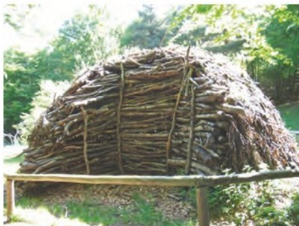
VISTA DE LA CARBONERA

Retomamos la ruta que hemos dejado continuando por el mismo sendero,